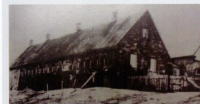
Vista de la casa del Gobernador Vernet en las Islas Malvinas.

El 19 de febrero de 1842, el Dr. Manuel Moreno, Encargado de Negocios argentino en Londres, recordó por nota al Conde de Aberdeen —entonces Secretario de Asuntos Exteriores del Reino Unido— la cuestión pendiente en relación con las Islas Malvinas. El funcionario británico informó en su nota de respuesta del 5 de marzo de 1842 que “acaba de ser inaugurado en esas islas un sistema permanente de colonización”.