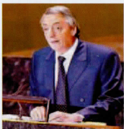
El ex Presidente de la República Argentina Néstor Kirchner (2003-2007) en la Asamblea General de las Naciones Unidas.

El conflicto de 1982 no alteró la naturaleza de la controversia de soberanía entre la Argentina y el Reino Unido por las Islas Malvinas, Georgias del Sur, Sandwich del Sur y los espacios marítimos circundantes, que continuó pendiente de negociación y solución. Así lo reconoció la Asamblea General en noviembre de 1982, cuando aprobó la Resolución 37/9, y lo reiteró mediante las resoluciones 38/12, 39/6, 40/21, 41/40, 42/19 y 43/25.