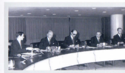
Inicialización Argentina - Reino Unido de la Declaración sobre Comunicaciones entre el territorio continental argentino y las Islas Malvinas. Buenos Aires, 1/7/1971.

Como resultado de esas conversaciones especiales ambos gobiernos arribaron, en 1971, a un acuerdo, bajo fórmula de soberanía, para cooperar en materia de servicios aéreos y marítimos regulares, y en comunicaciones postales, telegráficas y telefónicas; mientras que la Argentina asumió el compromiso de cooperar en los campos de la salud, educacional, agrícola y técnico.