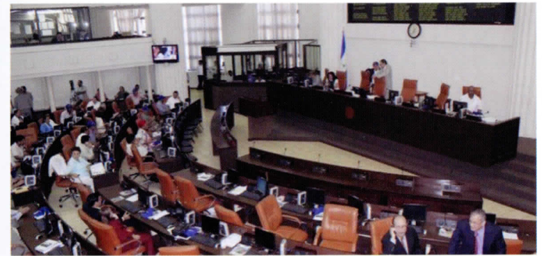
Asamblea Nacional | Archivo / END.

El Congreso de Nicaragua respaldó este jueves los reclamos de soberanía que hace Argentina sobre las islas Malvinas, ante las pretensiones británicas de iniciar exploraciones petroleras y militarizar la zona.